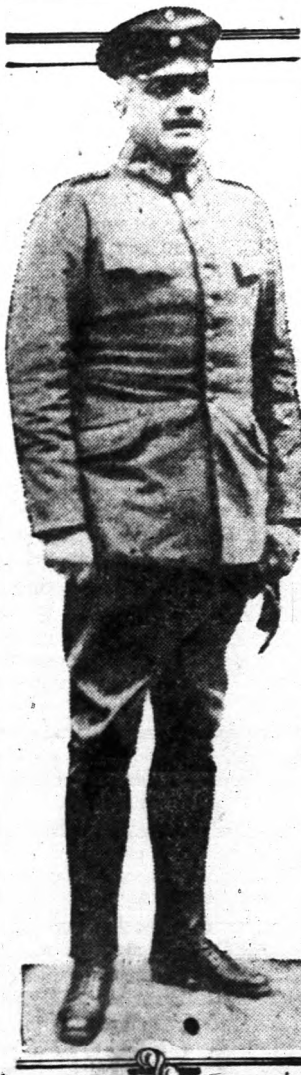
Baró Lüttwitz tábornok.

az ellenforradalom fő kezdeményezője, aki a csapatszálítósok zeregét főparancsnokává nevezte ki önmagát.