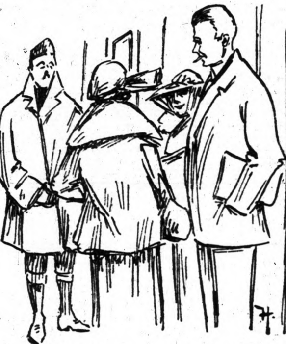
Angol vendégek a képviselőház folyosóján.