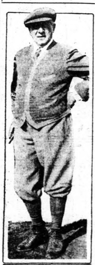
Charles M. Schwab, az acélkirály