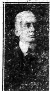
Rendelő órák: Reggel 9 órástól 4 óráig, este 6—8 óráig. 176 E. JEFFERSON AVENUE, Woodward Ave.-től keletre egy kitérő, DETROIT, MICHIGAN.