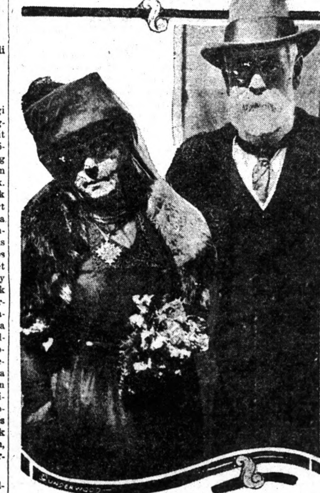
Az elmúlt napokban indult útjára az Egyesült Államok legújabb olaszországi nagykövete: Robert Underwood Johnson. A nagykövettel együtt távozott Amerikából felesége.

koztatását csak addig szabad felvetni, amíg nincs meg a lehetőség, hogy magunk is betudjuk szerezni a szükséges nyersanyagot.