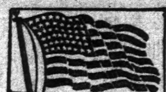
A legnagyobb és legnagyobb magyar nap- Amerikában. — Megjelenik minden nap.

NO. 32. SZÁM. HARMONIKAI ÁTVOLYAN. Cleveland, New York, Chicago, Pittsburgh, Detroit, Csitörtök, 1920. Április 6. THIRTIETH YEAR. EGYES SZÁM ÁRA 2 CENT