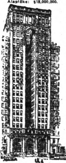
Alapítva: 1841-ik évben. Alapítók: $18,000,000.

küldjön dollárokat Magyarországra. A dollár külföldi kereslete miatt, Magyarországon a dollár árfolyama jobb mint itt. Az American Express Company elad külföldi chekkeit és pénztalványt dollár értékben, magyarországi pénzküldésére. Jugszláviába szintén csak is dollárértékben eszközöl átutalásokat.