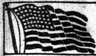
The oldest established and largest Hungarian Paper Published Daily.