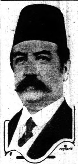
Törökország új miniszterelnöke, aki a legvalószínűbb helyzetben vállalta magára a kormányzás nehézségeit.