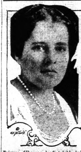
Frigyes főherceg legfiatalabb leánya, akinek eljegyzési híre a közelmultban járta végig a világsajtót.