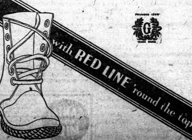
with RED LINE round the top