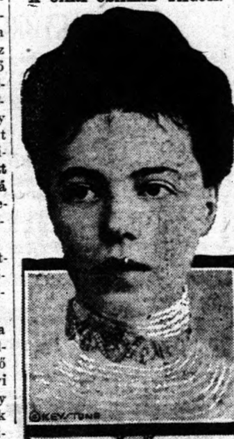
Olga nagyhercegné, az egykori orosz cár nővére, akit nemrég talált meg az amerikai Vörös Kereszt. A kivégzett cár nővére a legnagyobb nyomorban élt.