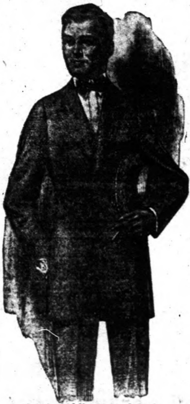
A mi "Aldine" modelünk

igen népszerűek az idén. Az egyszeműs "Aldine" féle a legkülönb mind között.