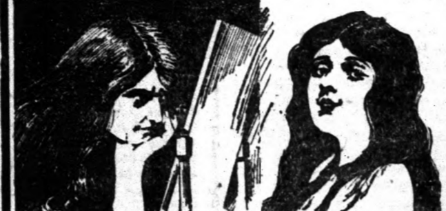
A tükör azt mondja, hogy öregszik. Ismét fiatal és bájos a Vörös Kereszt Hajfiatalító használatát folytatva.

A szép, fiatalos haj úgy férfínál, mint nőnél igen fontos s mindig bámulatót kelt.