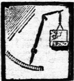
Egy újabb levél-mérleg.

— Ime, itt van egy egyszerű levél-mérleg. A mutató itt közvetlenül megmutatja, hogy mekkora a mérlegre tett levél sulya, természetesen, ha az osztályzatot előbb igazi sulyokkal megállapítottuk s megjelöltük, hogy 10—20—30 ouncenyi sulynál a mutató mennyire mozdul ki. Itt a suly ugyanaz marad s a kimozdulás méri a levél sulyát.