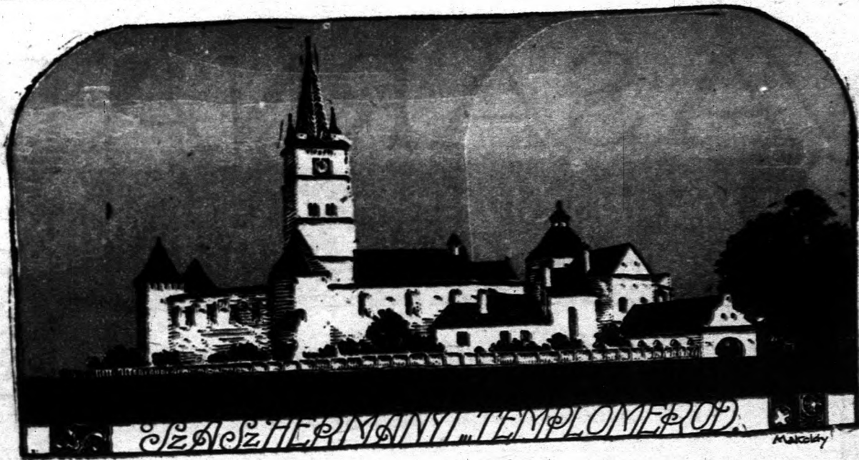
SZÉCHENYI TEMPLOM ERDÉLY