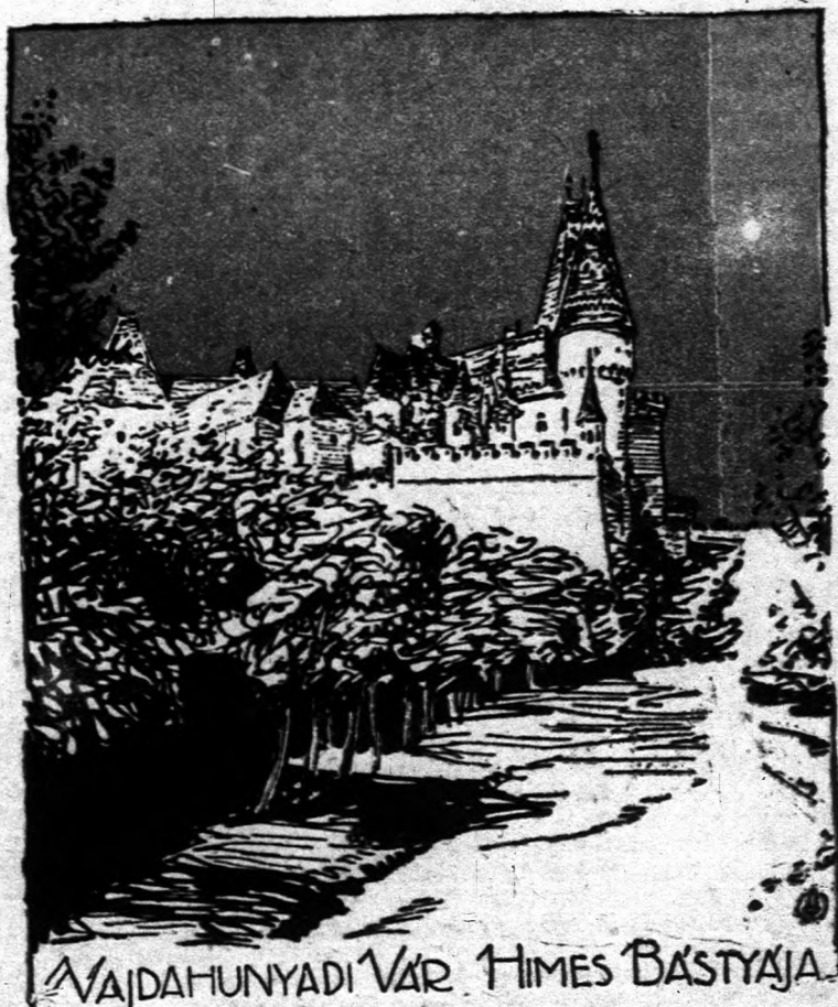
VAJDAHUNYADI VÁR HIMES BASTYAJA

A nyílt ellenséggel megküzdöttek bástyái, várai, templomvédő erősségei, no meg a magyar ökök, a székely fufang és a szász okosság. De a lassan elhatalmasodó betegség ellen a magyar sohasem tudott védekezni, mert nyílt szívű, vendégszerető, túlságosan bizalmas volt. Majd ez, majd amaz a beforakodott népesség döntötte katasztrófába. Erdélybe lassankint szivárgott be az oláh, eleinte a hegyeken, mint pásztor, majd a török elől seregestől özönlött be, (Folytatása a 11-ik oldalon.)