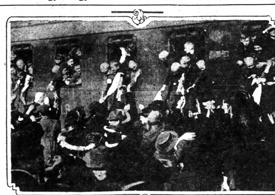
Erzékeny búcsú a bidepsti pályaudvaron.

Az éhező magyarországi gyermekeken megérett a szíve Európának. Hollandia, Olaszország, Svájc egymásután jelentkeztek, hogy hajlandók magyar gyermekeket "kosztba fogadni" és gondoskodni róluk addig, amíg teljesen magukhoz térnek. A közelmúltban indult el az első "gyerek-szállomány" Budapestről Hollandia felé. A pályaudvaron nagy tömeg gyűlt egybe és a szülők érzékeny búcsút vettek az "igeret földje" felé haladó apróságoktól.