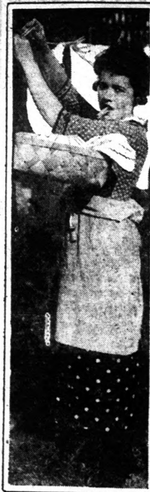
Marie Prevost, a legszebb formájú amerikai mozi művésznő hétköznapi munkájában.