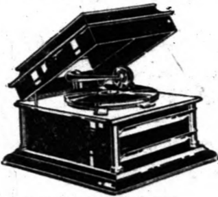
6 lemezrel, 13 dallal $55.10

Ezenkívül megvannak az összes és legrágább gramofonok is. Ugyancsak elvannak a legújabb és legjobb magyar lemezek, amelyeket üzletben kényelmes hallgatni szokásban meghallgathat, mielőtt azokat megvenné.