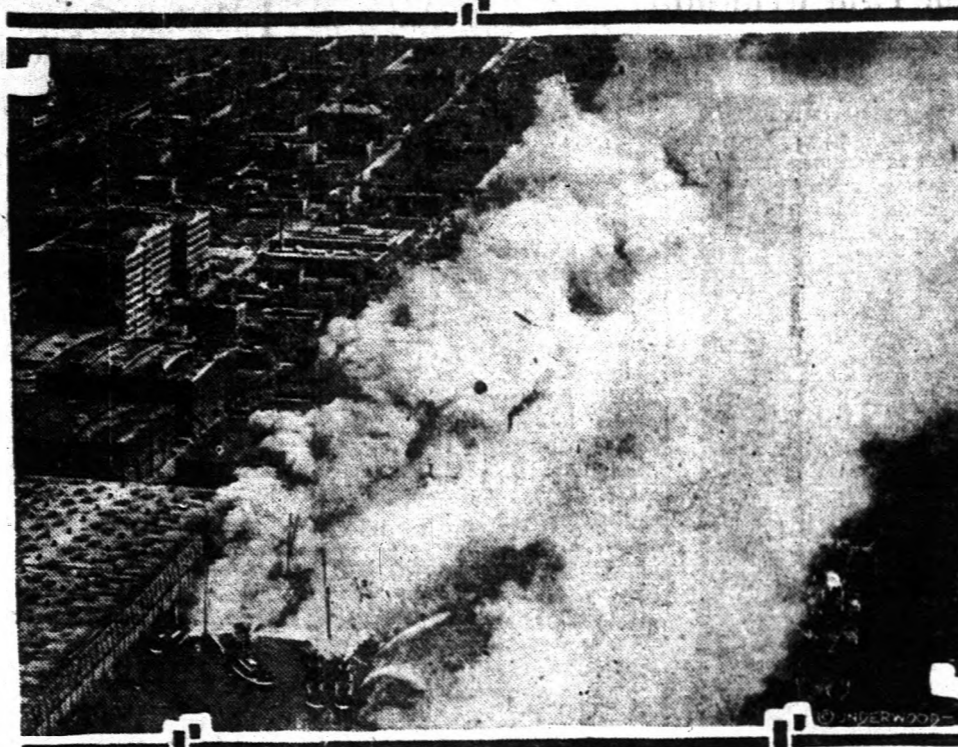
Az elmúlt hetekben szörnyű tüzvész pusztított a Brooklyni kikötőben, ahol kigyulladt egy oceánjáró tehergőzös és nyolc bárka. A lángok, több mint egymillió dollár értéket pusztítottak el.