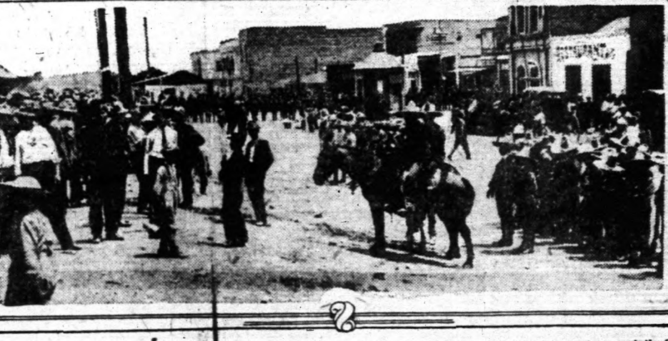
Felül: Guaymas látképe. — Alul: A Sonora állambeli Nagales, melynek egyik fele Mexicoból, másik fele az Egyesült Államokhoz tartozik.