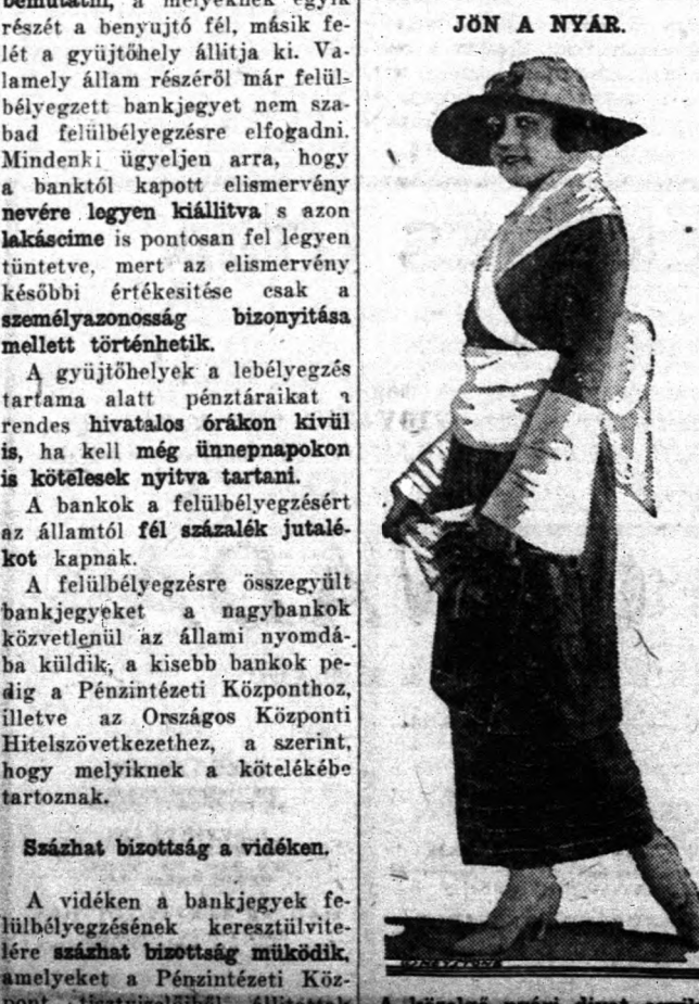
A köselő nyári divat egyik előhírnöke.

Minden patikában kapható vagy mi küldjük, biztosan. Egy nagy családi doboz ára $1.25, három doboz ára $3.15, míg hat doboz ára $5.25. Cím: H. E. Von Schlick, President, Marvel Products Company, 110 Marvel Bldg., Pittsburgh, Pa.