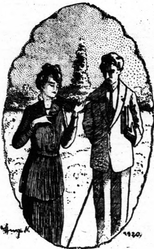
En irtózom tőle, mint ahogy irtózom egy holttesttől, amely lelketlenül jönne elem...

— Hát jó, jöjjünk tisztába egymással! Kicsoda ön? Folyton ezen tűnődöm és nem tudok tisztába jönni vele. Azt sem tudom, hogy honnan jött, mi volt azelőtt. Csak azt látom, hogy itt van és kiaknázza két rövidlátó öreg ember illuzióját. Ön hasonlít hozzá? Ön? Oh, ha ismerte volna őt! Talán akkor ön se merne ilyen vakmerő dolgot állítani. Sze-