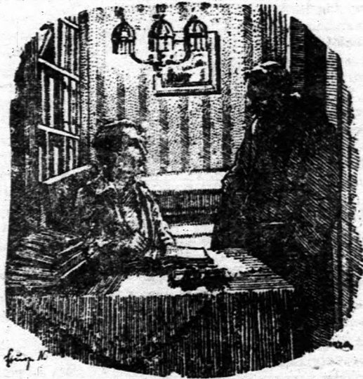
Sokáig aludtam ugy-e?