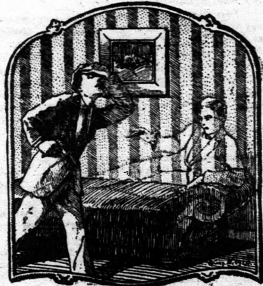
Az ágyból feleje mosolygott a Pista véres teteme, am... mosolygva biztatta: "No gyere ide mellem, megládd, majd téged is szeretni fognak!"