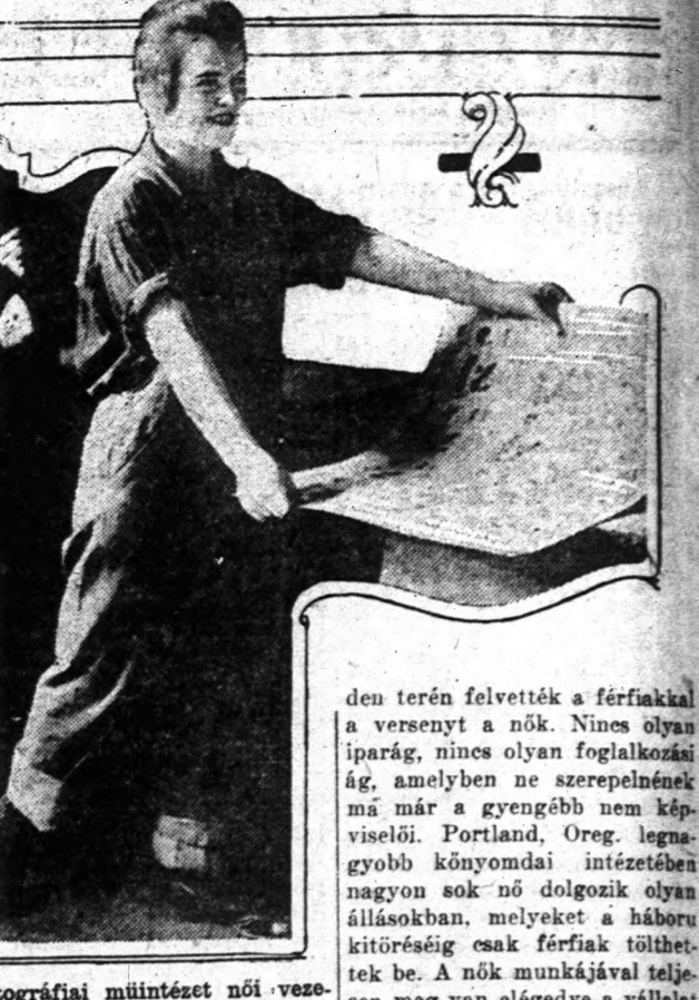
Litográfiai műintézet női ve-zetője Portland, Oregonban.

Van elég só Clevelandban. Hála is érte a gondviselőnek, mert hiszen hova jutnánk, ha a sónép is ránk szakadna. Hiszen csak néhány féle hasz-nálatt hozzuk emlékeztünk-be: — Beszörjék vele a sózöngé-ket, hogy a moly ne essék be-le. — Ha a pisilógó szénre hintik, feléled újból a lángja. — A sikos járdán felovaszolja a jeget. Hó és jég közt szörva fokozza a fagyás erőjét. — A fehérmű mosást meg-könnyíti.