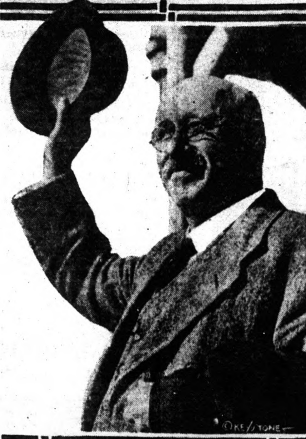
William E. (Pussyfoot) Johnson megérkezik New Yorkban.

Hónapokon keresztül állandó beszéd tárgya volt Angliában Pussyfoot Johnson a száraz apostol, aki Londonban számos elő- adást tartott a proibíció mellett. Egyik előadása után jökdé- ngol diákok megtámadták és tüntetés közben, sajátos mó- don, kiverték egyik szemét. Johnson hetekig feküdt kórházban és most visszatért Amerikába, ahol folytatni munkáját. Megér- kezésekor azt mondta, hogy Anglia tiz év múlva épp oly szá- raz lesz, mint Amerika.