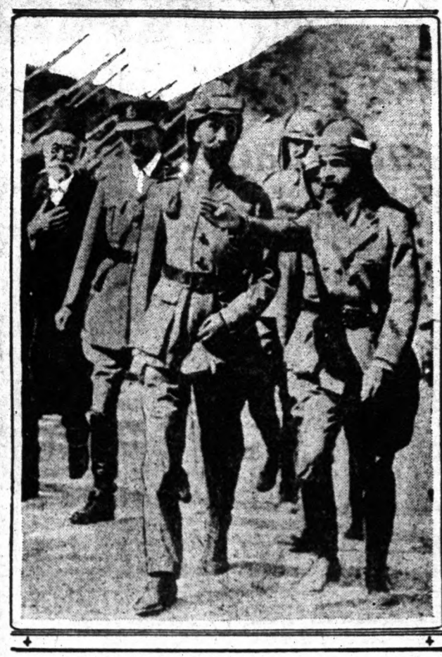
Feisal emir csapatsemlét tart.

D'Annunzio példáját követte Feisal emir, akit a közelmúltban Szíria királyának kiáltottak ki. A szövetségesek nem akarják elismerni az ország függetlenségét és önállóságát, de az új király dacol velük.