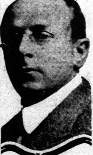
Homer S. Cummings.

Homer S. Cummings, a demokraták nemzeti bizottságának elnöke választották meg arra a tisztségre, hogy a San Francisco-i elnökjelölő konvenciót vezesse.