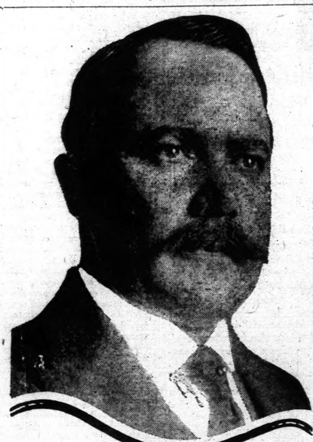
Alvaro Obregón tábornok.

A legutolsó mexicói híradások szerint, Alvaro Obregón tábornok bevonult Mexico Citybe és e pillanatban teljesen ura a helyzetnek. A félkeze gabaly, — aki csatában vesztette el, éveikkel ezelőtt, egyik karját, — régóta nagy szerepet játszik a mexicói forrongó politikai életben és egyidejűleg Carranza legrosszabb ellensége volt.