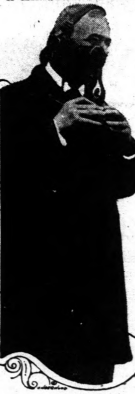
Josephus Daniels tengerészeti ügyi miniszter.

aki legutóbb egyik amerikai hadihajóról beszélgetést folytatott drótnélküli telefonon.