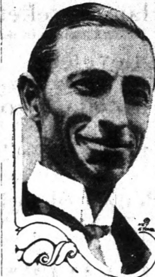
Hugh Gibson, az Egyesült Államok lengyelországi nagykövete.

Az elmúlt napokban visszaszólította Colby külügyminiszter Amerikába Hugh Gibson amerikai követet, hogy részletes jelentést tegyen a vorosók lengyelországi munkálkodásáról.