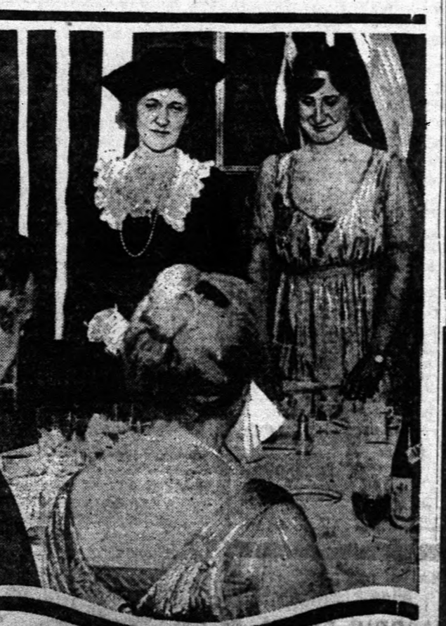
Baloldalon: Lady Astor, a jobb oldalon: Lady Gaddes. Az angol birodalom új washingtoni nagykövetségét meleg búcsút vet London előkelő társasága. A búcsúzás egyuttal Sir Gaddes feleségének is szólt, aki a londoni előkelő világ egyik legrokon-szerűsebb tagja.