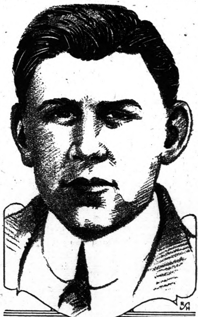
Adolfo de la Huerta.

Adolfo de la Huerta, Sonora állam kormányzóját választotta meg a köztársaság ideiglenes elnökének a mexicói kongresszus. Az új elnök néhány hétig viseli csak hivatalát, mielőtt leszáll az alkotmányos elnöksévről.