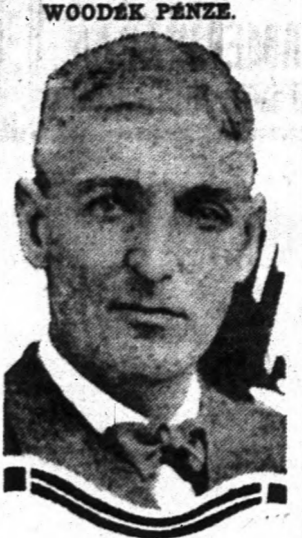
William Cooper Procter ezredes

Az Egyesült Államokban levő malomok ez év április hónapjában 66,900,000 font gnyapot dolgoztak fel, míg az elmúlt év április hónapjában a feldolgozott gnyap mennyisége alig haladta meg a 45,000,000 fontot.