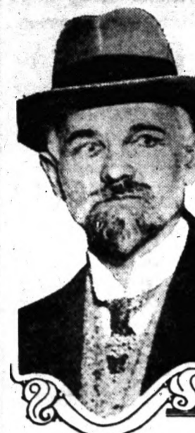
Leonid B. Krassin.

Leonid B. Krassin, oroszországi népbiztos, hivatalos tárgyalásokat kezdett Lloyd George-al annak érdekében, hogy rendes kereskedelmi forgalmat kezdődjék meg Anglia és a szovjet Oroszország között. A tanácskozások, melyek minden féléves szerint, eredményesen végződnek, nagy feltűnést keltenek az egész világon.