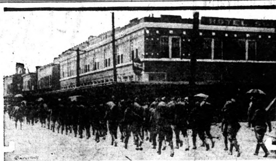
Galvestonban hosszú idő óta sztrájkolnak a kikötő munkások. Az elkészesített bérharc zavarokra és zavargásokra adott alkalmat és így a texasi állami katonaságot rendelte ki a kormányzó a törvényes rend megőrzése érdekében.