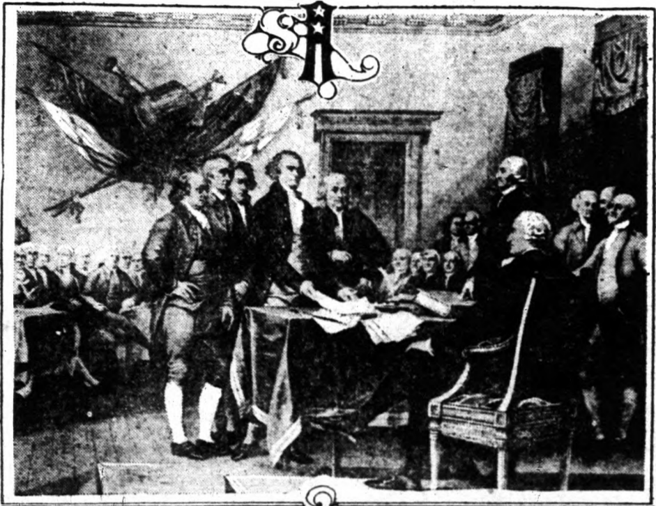
A "Declaration of Independence" betérjesztése.

Az amerikai történelem legnagyobb eseményét örökíti meg az a festmény, mely a függetlenségi nyilatkozat szerzőinek tanácskozási ábrázolja. Thomas Jefferson, Benjamin Franklin. A jobb oldalon álló hatalmas ember Charles Thomson.