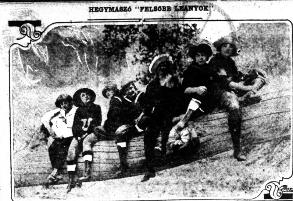
Az Utahi egyetem női hallgatói merész utra vállalkoztak. Fölkerezték a New Zion-i nemzeti parkot, hogy annak olyan részeit fölfedezzék, ahol ember sohasem járt még.