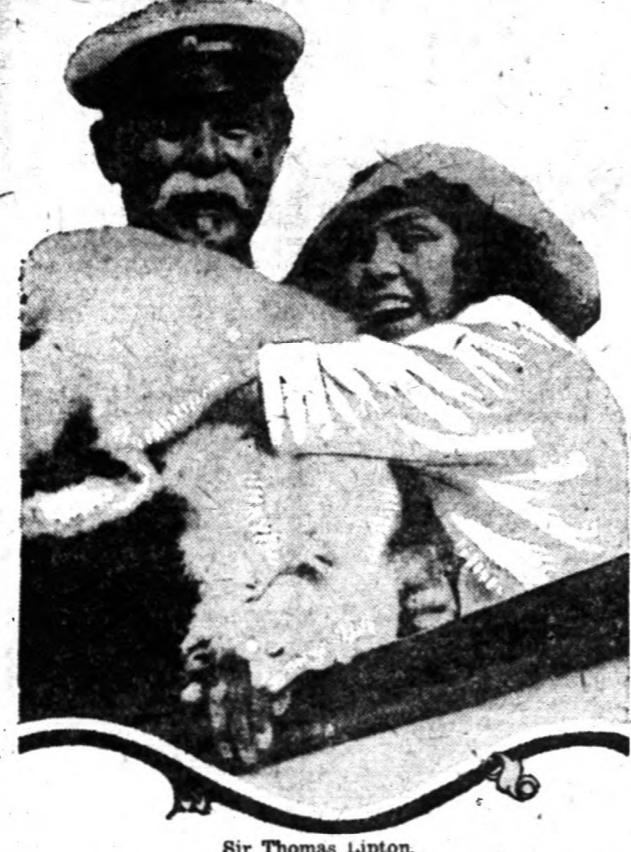
Sir Thomas Lipton.

aki Shamrock IV. nevű vitorlásával meg akarta nyerni a New York Yacht club hagyományos serejét. Az angol sportember terve hajótörést szenvedett, mert a versenynek a Resolute nevű amerikai vitorlás győzelmével ért meg.