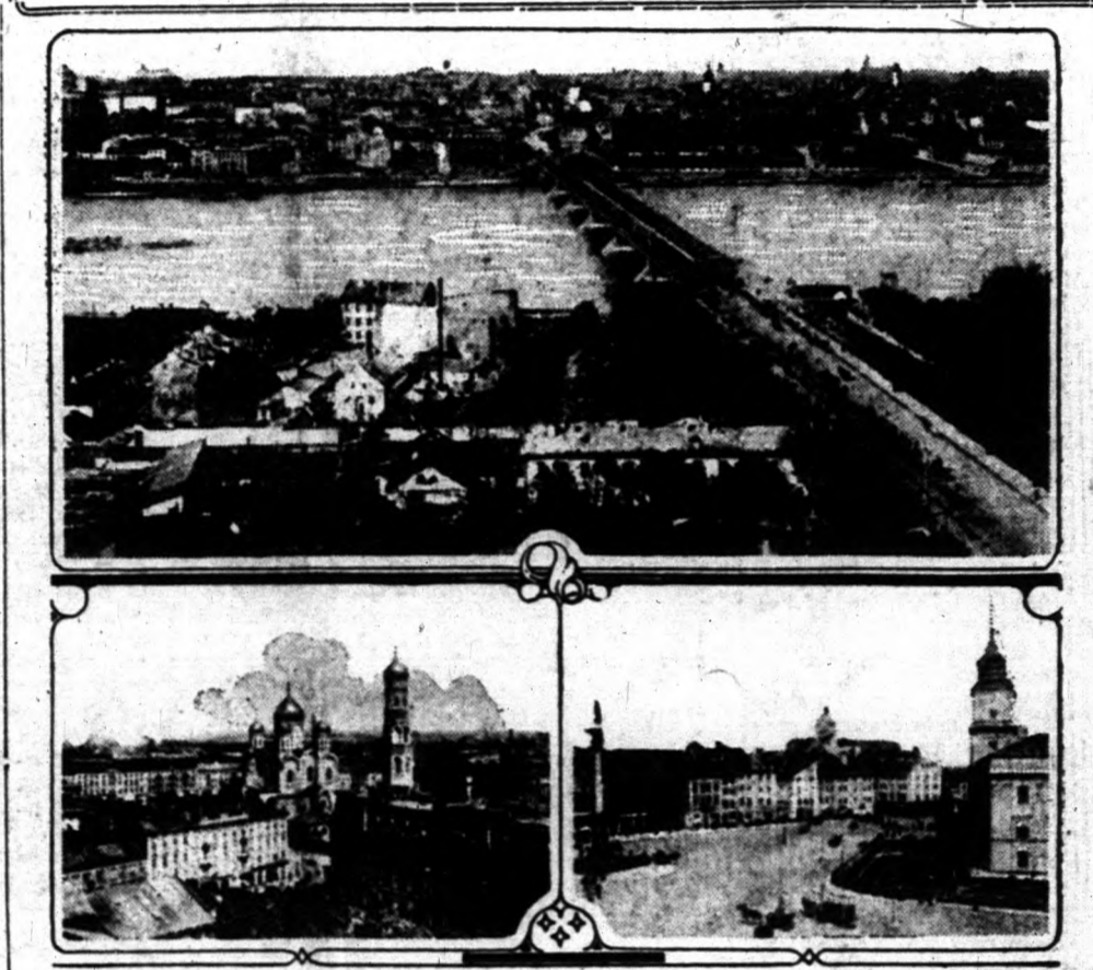
Felül: Varsó látképe az Alekszandrovsk hídval, mely a Visztulán, Prágával, a pompás külvárossal köti össze Varsót. — Alul: Kilátás a lutheránus templom tornyából és a Zsigmond király tér.