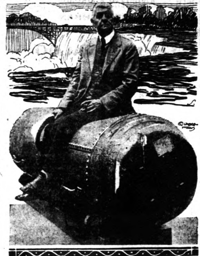
Bobby Leach, aki 1911-ben egy alkalommal szerencsésen "megusztá" a Niagarát, ismét arra készül, hogy aefőrdőhába bujva, megtegye az életveszélyes utat. Nem valószínű, hogy az amerikai és kanadai hatóságok megadják neki az engedélyt.