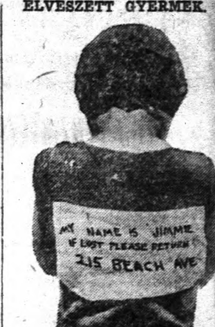
New York városában sürűn láthatunk apró gyermekeket, akik cédlát viselnek hátukon, melyen nevík és szülei lakomelye van feltüntetve. Az utóbbi időkben rengeteg gyermek tűnt el és oka a szokatlan elővigyázatosságnak.

Az idős fejfájásnak legjobb orvossága a nyugalom és jó alvás, az erős fegyelem, tisztos levegő, a hideg borogatás, ha szorultól fáj a fejünk, vegyünk be hashajtót.