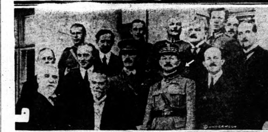
Varsó város népe, apraja nagyja a fenyegetett város védelmére siet. — Alul: Weygand tábornok, a lengyel vezérkar élén, mely nem csak megállította, de erősen visszazorította a vörösöket.