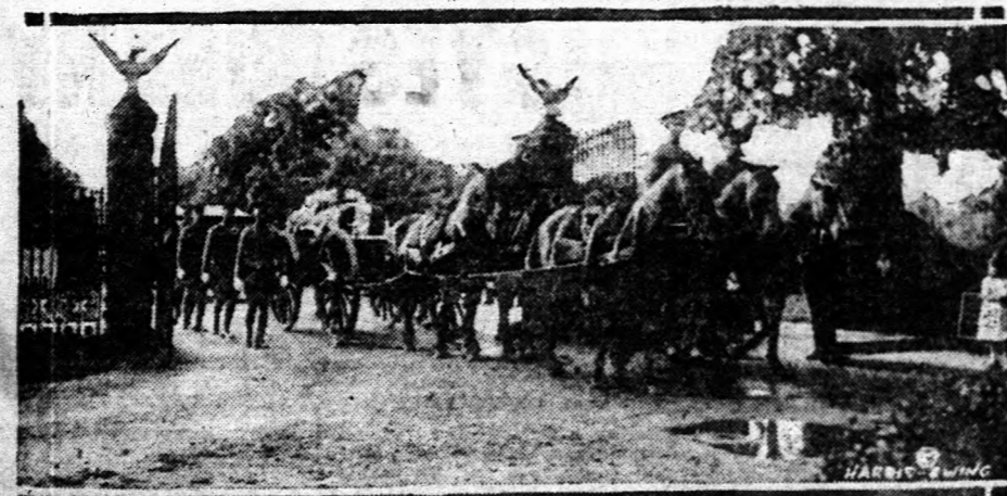
Az elmúlt napokban halt meg Grogas tábornok, aki az Egyesült Államok hadseregének orvosai között a legnagyobb rangot viselte. A nemzet halottját Washingtonban temették és pártatlan orvospompával kísérték ki az Arlington-i temetőbe.