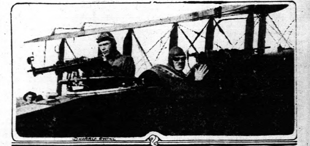
Katonai gyakorlat repülőgépek elleni védekezés céljából.

re rosszabbul lett. A sorsát azonban megdávással, esendően tartja. Esendően harcolt a halállal.