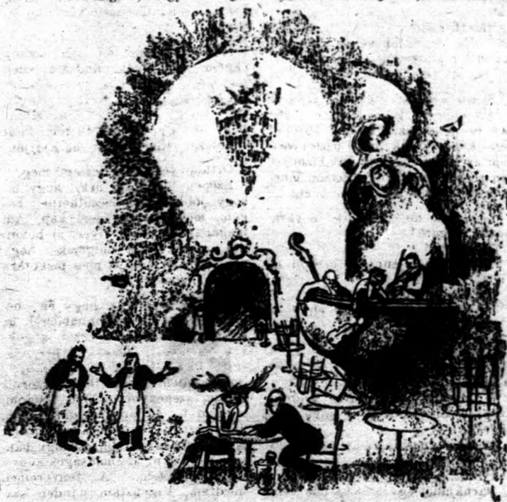
Budapesti kávéház bejárata a kora hajnali órákban.

Kun Béla egyik bolshevik vezető. (Folytatás a 14-ik oldalon.)