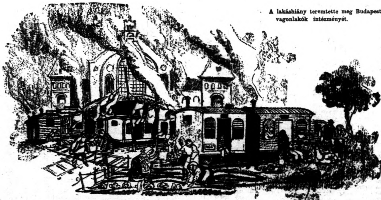
A lakáshiány teremtette meg Budapesten a vagonlakók intézményét.