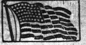
A legnagyobb és legnagyobb magyar lap Amerikában. — Megjelenik minden nap.

Beolvadt lapok: Magyar Híradó, Magyarok Csillaga, Esti Újság, Amerikai Hírlap, Magyar Napilap, Magyar Hírmondó, Californiai Magyar Farmer.