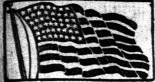
The oldest established and largest Hungarian Paper Published Daily.