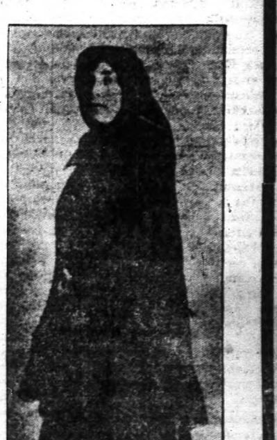
Berliner kendő eleje

A mai napon küldtünk 10,000 példónak legujabb árjegyzéket, ha a mai napig nem kapta meg, úgy KÉRJEN EGYET MEG MA!