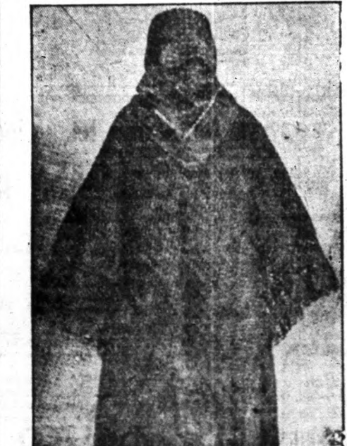
A berliner kendő háta