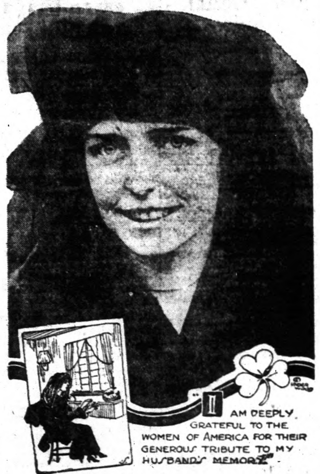
Az éhségstrájk áldozatának fiatal özvegye.

Az ir köztársaság pártívei Irországnak a saját tapasztalatait is az angol hatóságokkal. Azaz vádolta ezeket, hogy a családrol azt a hamis hírt kelettek, mintha ők titokban táplálékot hordottak volna MacSwineynek. Ez szerinte olyan közönséges hazugság volt, mint minden, amit az angol hatóságok Irországra felől világnak bocsátottak.