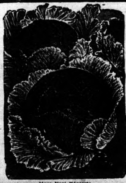
János Napi Képzőművésztől