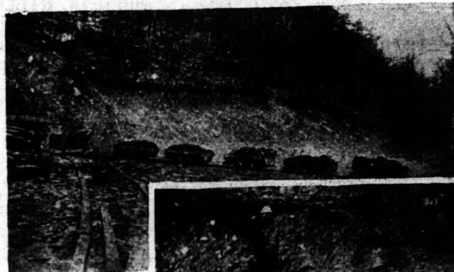
Másik látképe a 2-ik számú tárna bejáratának az általunk bányászott szénnel megrakott kocsikkal.