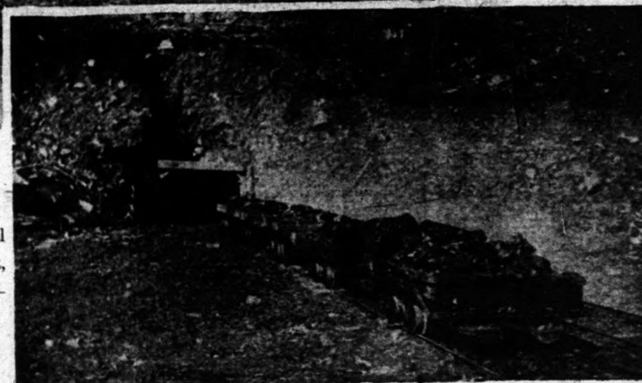
Három kocsit hagyja el a 2-ik számú tárna, szénnel megrakodva.

Securities in class "D" Under Illinois Securities Law These are Speculative Securities COMMERCIAL COAL & COKE COMPANY