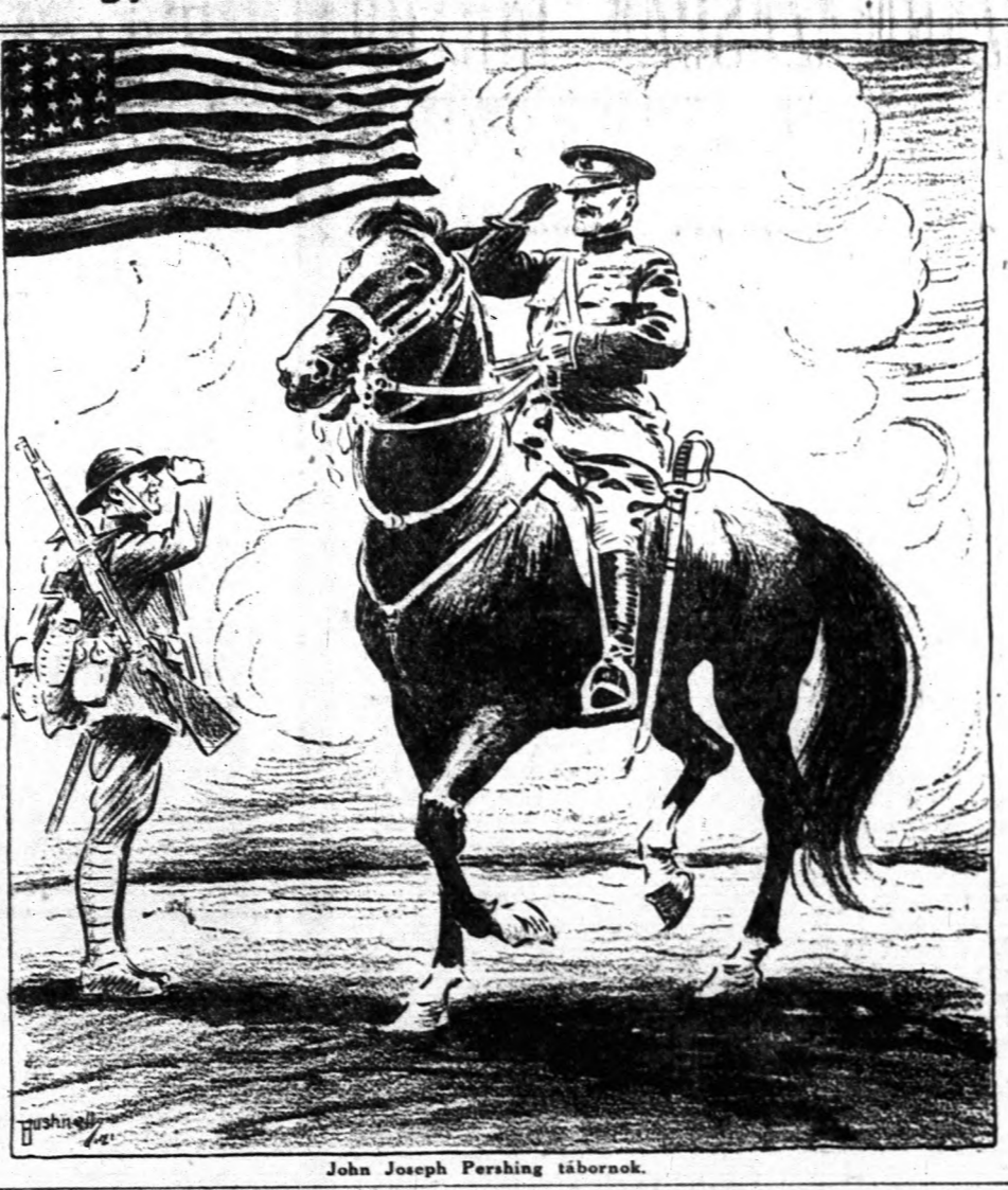
John Joseph Pershing tábornok.