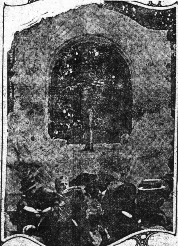
AZ ELMULT napokban leplezték le Bécsben Johann Strauss-nak, a halhatatlan valcer-királynak pompás szobrát.