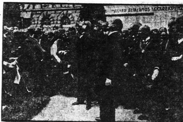
HEGEDÜS LÓRÁNT pénzügyminiszter beszédet tart a Jókai-szobor leleplezésénél.