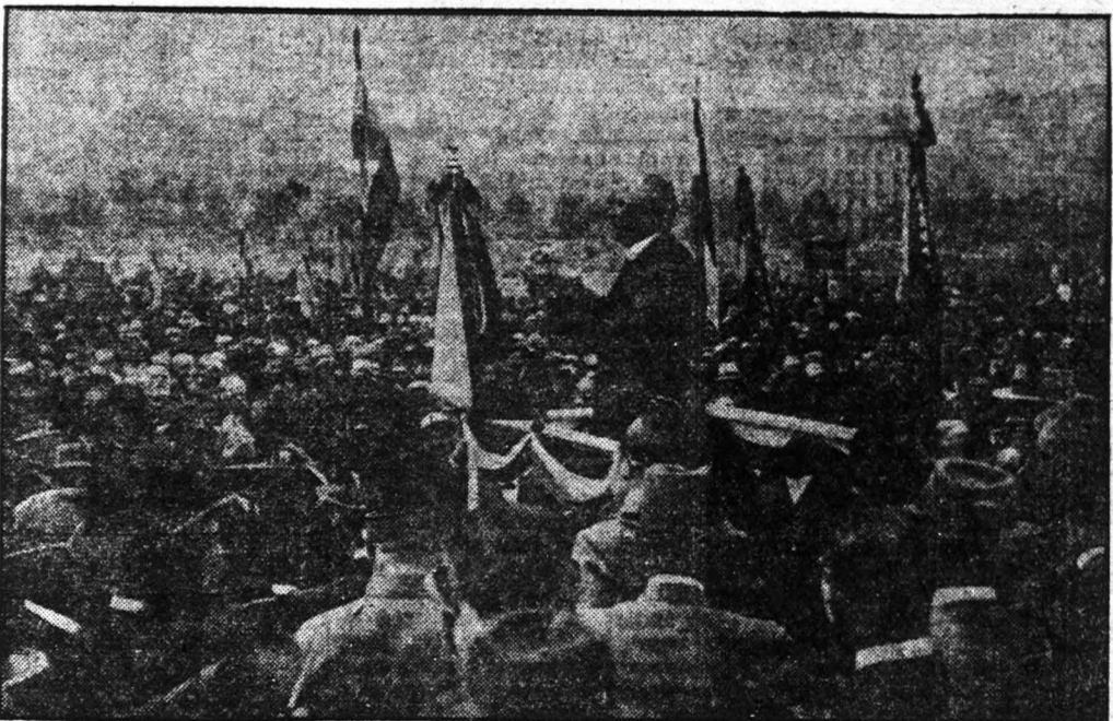
NAGYATÁDI SZABÓ ISTVÁN földművelésügyi miniszter beszédet tart a kigazdák nagy-gyűlésén.