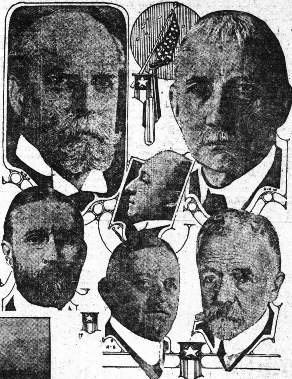
AZ EGESZ világ példátlan érdeklődéssel lesi azt az időt, amikor megkezdődik a lefegyverzési konferencia Washingtonban. Kétségtelen ma már, hogy Harding elnök felhívása meghallgatásra talált a világ minden részében. Eddig annyi bizonyos, hogy az Egyesült Államok delegátusának Hughes külügyminiszter és Lodge szenátor lesznek vezetők. A konferencia amerikai nagyságai közül a következőket mutatja be fentebbi képünk: felül, balról jobbra: Charles E. Hughes és Elihu Root; középtűt: Philander C. Knox szenátor; alul: George Sutherland, Oscar Underwood és Henry Cabot Lodge szenátorok.