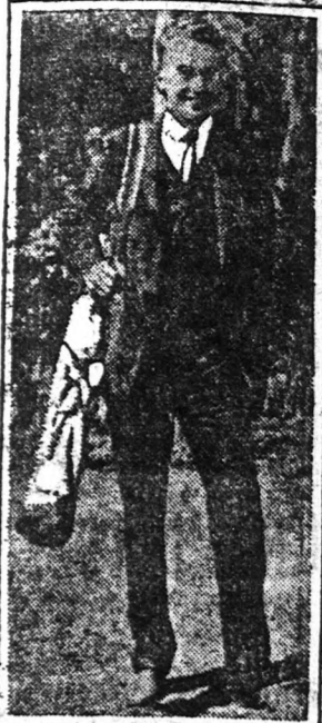
CORNELIUS VANDERBILT Jr., kétszázötven évesen a világ leggazdagabb riporterere. Egyik new yorki napilapnál dolgozik a sokszoros milliomos, aki most Canadába utazott "vakációra".