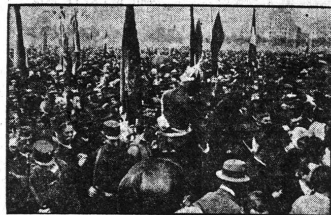
TÖMEGES felvonulás Budapesten. A kép közepén teljes díszben lovagol a "pesti rendőr".