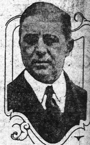
CHARLES B. WARREN lett az Egyesült Államok új nagykövete Tokióban. Harding elnök alapos megfontolás után nevezte ki a fontos diplomáciai küldetésre a detroiti férfit, akire igazán nagy feladatok megoldása várhat a közeljövőben. A japán-amerikai "válság" örökösen fenyeget és így érthető, mily nagyfontosságú kérdés, hogy ki áll a tokiói nagykövetség élén.