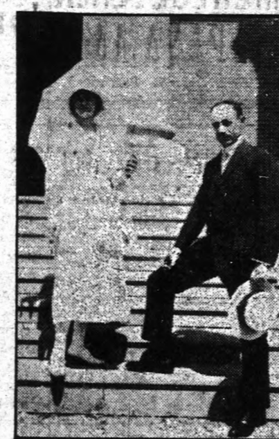
Gróf Teleki Pál és felesége.

Utam céljához értem a grönörű Grace Hallban vagyok, a Williams college dísztermében, mint a hogyan odabaha mondanék. Ez a csarnok remek keret, igazán klasz szikus háttér a Politikai Intézet előadásaihoz.