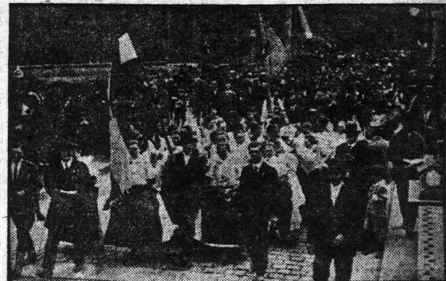
MAGYAR gardák és kigazdák női csatlósai felvonulnak a budapesti nagy gazda-gyűlésre.