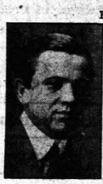
Berlin, szeptember 6-án.

Német színlolok Irta: Reményi József a Szabadság európai munkatársa