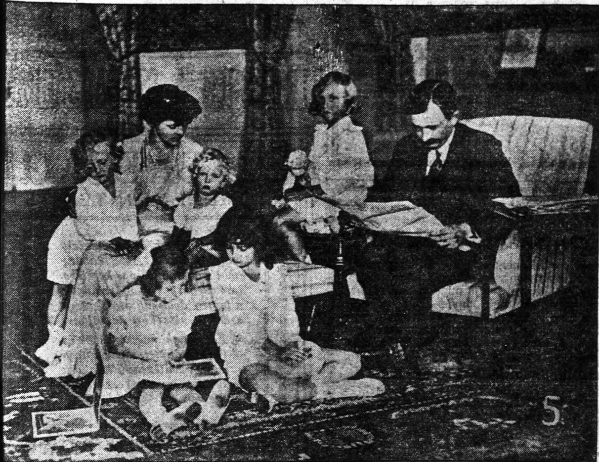
5. — VILLA PRANGIN-ban, Svájcban készült ez a felvétel, mielőtt még az első kísérletet tette volna a trón visszaszerzése érdekében Károly. Pranginban nyugodt életet élt a Habsburg család és akkor senkinek sejtette még, hogy a hirtelen természettől ex-uralkodónak az lesz a vége, hogy a nagyhatalmak deportálják.