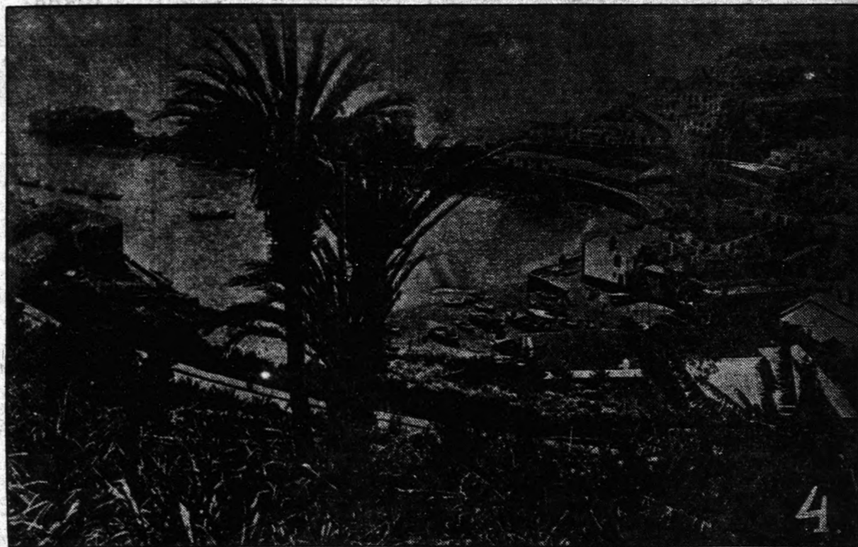
4. — MADEIRA szigete, amely a királyi pár végállomása lesz. A nagyhatalmak döntése alapján, Portugália beleegyezett abba, hogy Károlynak és családjának menedékhelyet ad, Madeira szigetének fővárosában, Funchal-ban. A királyi pár már utban van a sziget felé, mely Marokko nyugati partjaitól 440 mértföldnyire fekszik. Madeira a világ egyik legpompásabb szigete, ahol ideális életet élhet családjával együtt, a száműzött Habsburg.