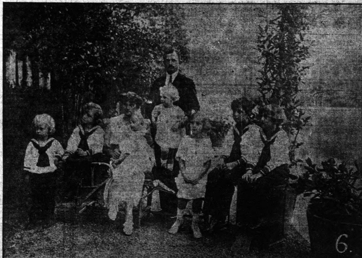
6. — HERSTENSTEIN kastély kertjében készült ez a legújabb felvétel, melyen együtt láthatjuk az egész családot. Zita ex-királyné a legkisebb gyermeket, Róbert főherceget tartja glében, míg Károly Károly Lajos főherceget "ámogatja". Ez a családi felvétel huszonnégy órával a repülőgépes kirándulás előtt készült, mintha megértené volna a "királyi pár", hogy sok idő telik majd el, míg megint ilyen szépen együtt lesz az egész familia.