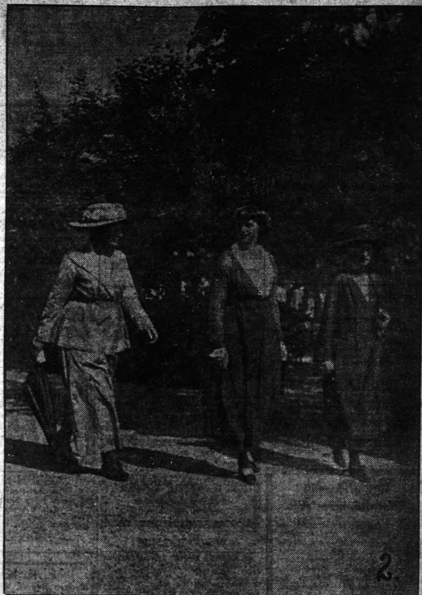
2. — ZITA "királyné" két udvarhölgyével sétál a Hertensteini kastély kertjében. Ezt a felvételt, mely most érkezett Amerikába, közvetlenül a királyi pár szökése előtt készítették Svájcban.