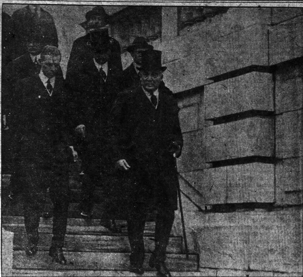
Harding elnök megérkezik a "Daughters of American Revolution" épülete elé, ahol ünnepélyes beszéddel megnyitotta a lefegyverzési konferenciát.

A franciák ez ellen is egész erővel tiltakozni fognak és amennyiben lehetséges, meg is próbálják akadályozni azt.