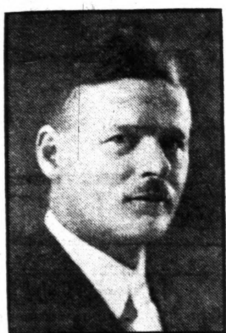
WARGA EDE SALES MANAGER.

Irodánkban évek óta működik, számtalan családnak közvetített kellemes otthonot. Több eladási egyeseknek vagyont takarított meg. Bízva állítjuk, hogy az East Side-on ő bonyolított le legtöbb házeladást és eladást. A magyarság körében 9 éve működik, s ebből 4 évet a "Metropolitan" elnevezésű társaságnál mint ki-tüntetett ügynök töltött el.