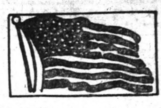
A legnépesebb és legnagyobb magyar lap Amerikában. — Megjelenik minden nap

Bolvadit lapok: Magyar Híradó, Magyarok Csillara, Esti Ujság, Amerikai Hírlap, Magyar Napilap, Magyar Hírmondó, Californiai Magyar Farmer