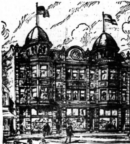
A WEIZER CSALAD ÉPULETE.

Irodánk eddig elért eredménye, melyről a sajtó is elismeréssel nyilatkozott, kellő biztositékul szolgál honfitársainknak arra nézve, hogy teljes bizalommal forduljanak hozzánk. A bevándorlás különböző formában korlátozásoknak van kitéve, ha van, kit ki akar hozatni, jöjjön be irodánkba, mi ószintén megmondjuk, hogy lehet-e kihozatni és ha igen, mily módon, mily feltételek alatt.