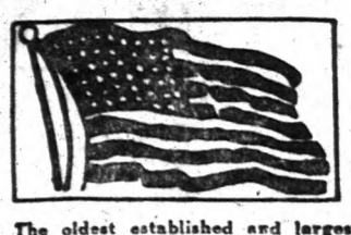
The oldest established and largest Hungarian Paper Published Daily

ez utolsó pillanatokban is láttá, hogy kéjszóval, tévesen, vagy aköz szellemel nézi meztelenségét. Az- tán hangosan szóval hozzá: — Leány kérted-e isten bocsánatát bűneidért és mulasztásaidért? Fülédhez hajolt és hozzátette (a nézők azt hiték, hogy utolsó gyónásait hallgattja): — Akarsz engem? Még megmegtérhetlek! A leány mervev nézett rá.