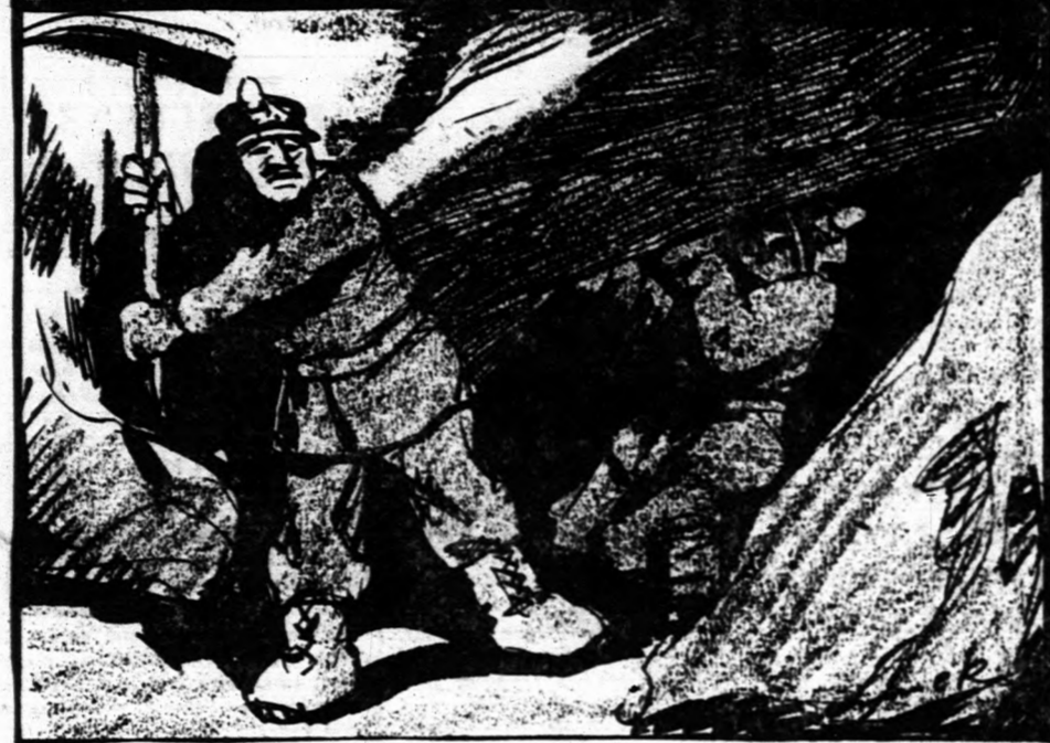
HOGYAN DOLGOZNAK A MAGYAROK AMERIKÁBAN.