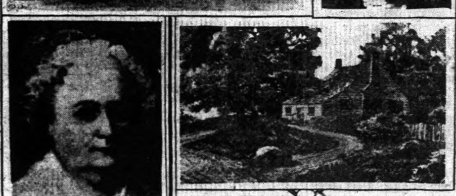
Washington György és felesége, Martha; Washington Mt. Vernoni otthona és Washington születésének helye Virginia államban Westmoreland countyben.