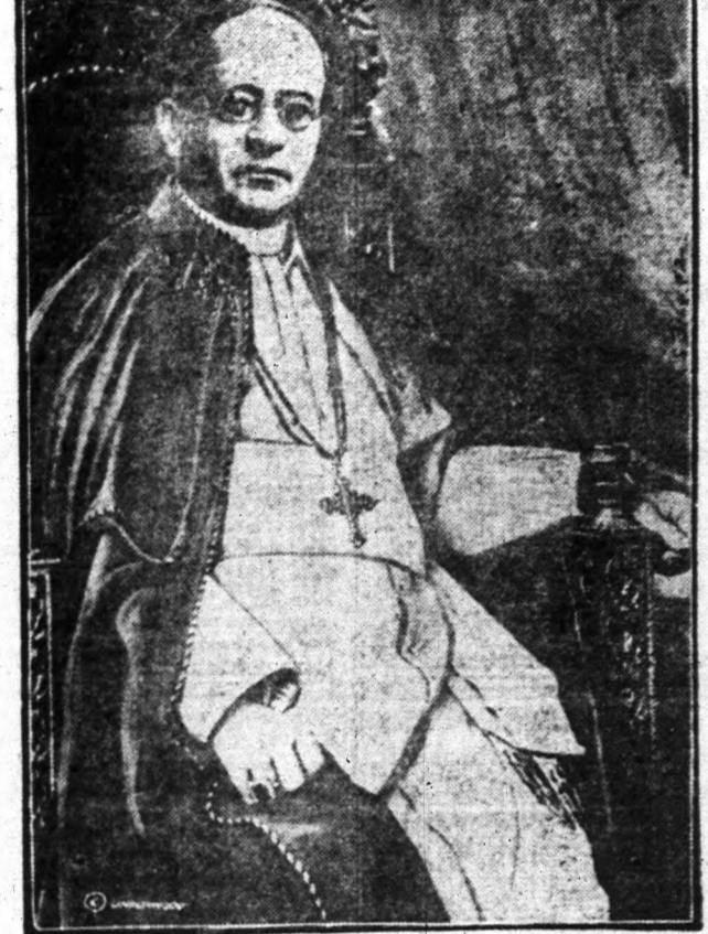
Az első felvétel, a Szentatyáról a koronázás után. A pápai trónon teljes fejedelmi díszben ül a katolikus világ új ura.