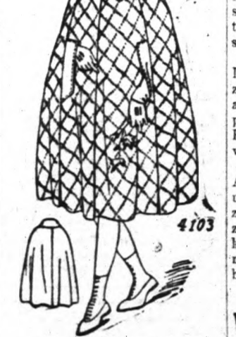
4103. Leány kopony.

Mustrája 6 féle nagyságban kapható, 6, 8, 10, 12, 14 és 16 éves leányknak vagy megfelelő nagyságu asszonynak való. A 12 éves termeter való kopony elkészítéséhez 4 yard kell a 44 inches kelméből. A mustra ára 12 cent. Bemutatunk egy elegáns női ruhát is.