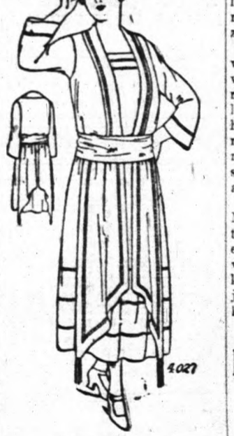
4027. Női ruha.

Mustrája 7 féle nagyságban kapható, 36, 38, 40, 42, 44, 46 és 48 inches mellbőséggel. A 38 inches ruha elkészítéséhez 6 1/2 yard kell a 40 inches kelméből. Az aljbőség vagy 2 yard. A mustra ára 12 cent. Rendelje meg az alábbi kis rendelési szelvényen. Vágja ki, töltse ki és küldje be címünkre a megfelelő összegegel, ami blyegben is mellékelhető.