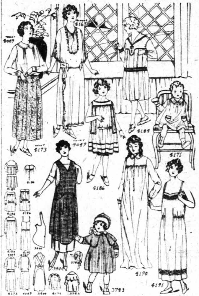
4009 és 4173. Női kosztüm. 4167. Blúz mustrája 7 nagyságban kapható: 36, 38, 40, 42, 44 és 48 inces mellbőséggel. Ára 12 cent.

Sohol sem lehet olcsóbban beszerezni mustrát, mint a Szabászi Iskolánkban. Csekély 12 centért küldjük a patterneket és csekély 12 centért a Divat Könyvünket, amelyből aztán rendelhet bárki mustrákat. A 12 centes bélyegben vagy készpénzben kell beküldeni. Money Orderon is lehet, de az bizonyára nem olyan kényelmes. Fontos, hogy ne csak a pénz ne hiányozzék a levélből, de a szabásminta száma és a nagyságának a megjelölése. Sok rendelés azért késik, mert a rendelés nem tudta velünk a nagyságot. Bemutatunk most egy pompás koszorút a tavaszi divatképekből. Válassza ki a szíves olvasó a neki tetszőt és rendelje meg a mustráját. A mustra után, amint minden varrni tudó nő tudja, könnyű elkészíteni a ruhadarabot. Itt a kép csoportot a alatta következnek számok szerint a mustrák rövid ismertetése: