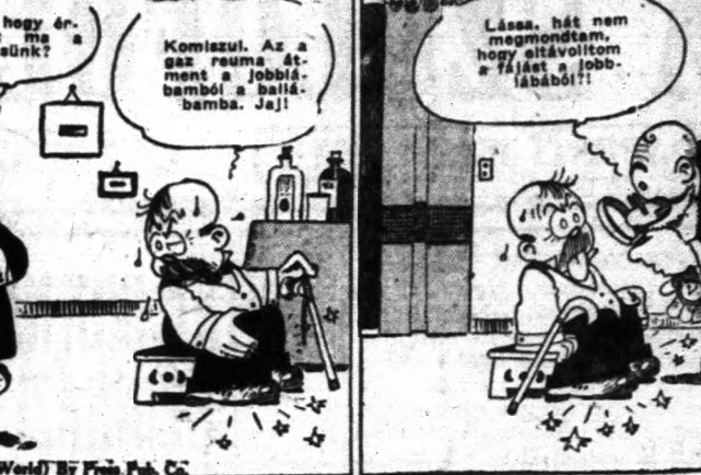
W. H. Schwartz. (U. S. E. World) by Fred K. Co.