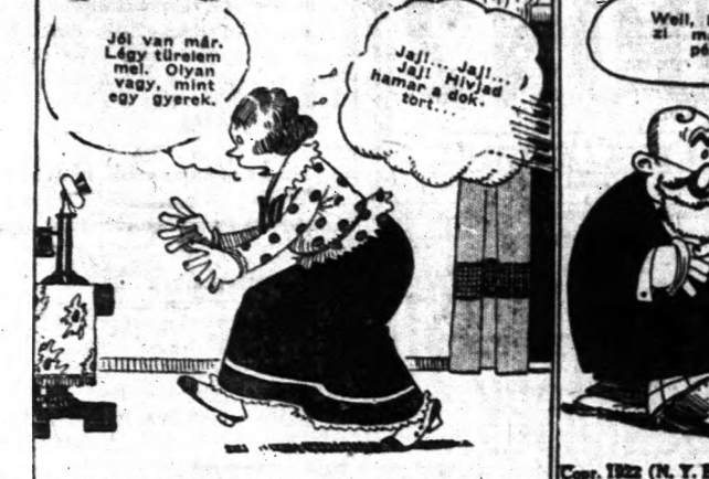
W. H. Schwartz. (U. S. E. World) by Fred K. Co.