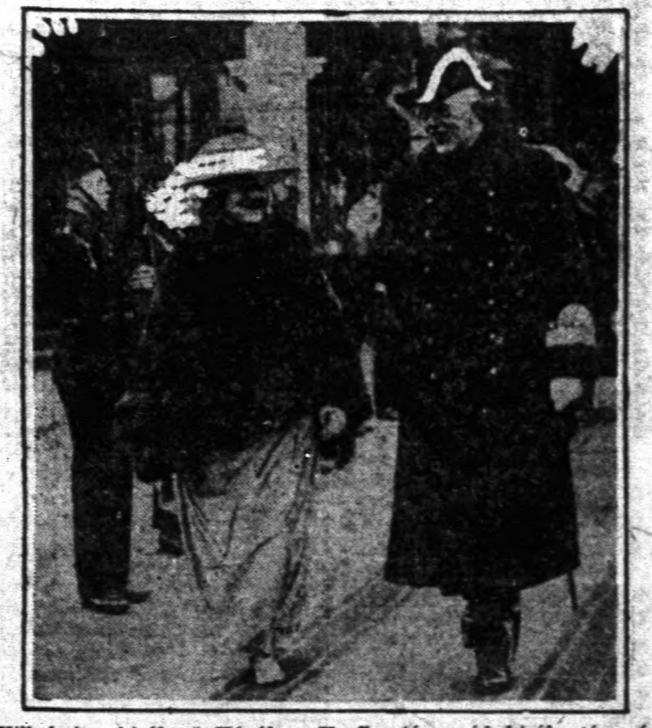
Vilhelmina királynő Hágában V. Gusztáv svéd király társaságában. A svédék királynő most adta vissza a hollandi királynő múlt évi svédországi látogatását.