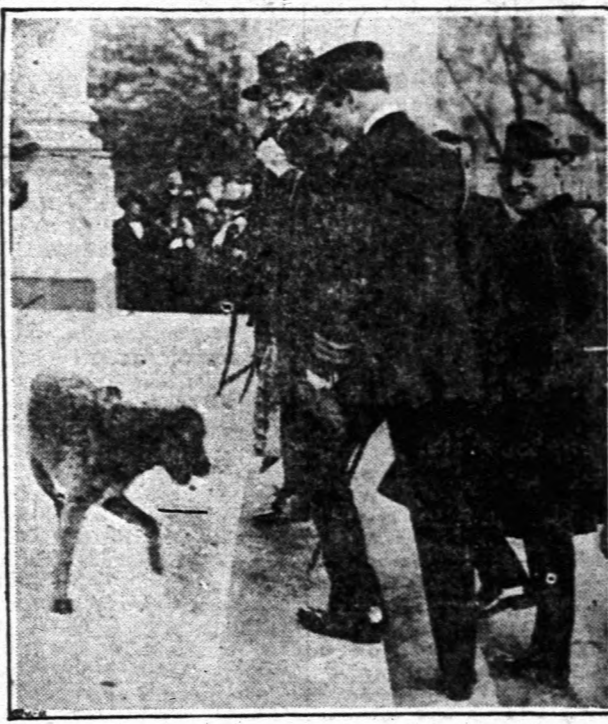
Laddie Boy, a Fehér Ház híres arodala kutyája, üdvözölte a gazdáját és gazdasszonyát.