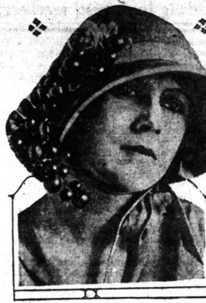
Lady Elizabeth Bowes Lyon válassza. Jobbra egy barna szőrzetű ruhát, ugyanolyan anyagból készült kalappal, Paris legújabb kreációja. Balra szürkés selyemből készült kalap, gyönyörű díszítéssel, szintén Paris legújabb kreációja.