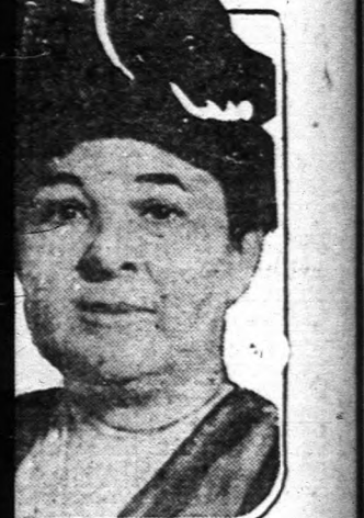
Mrs. Henry Ford.