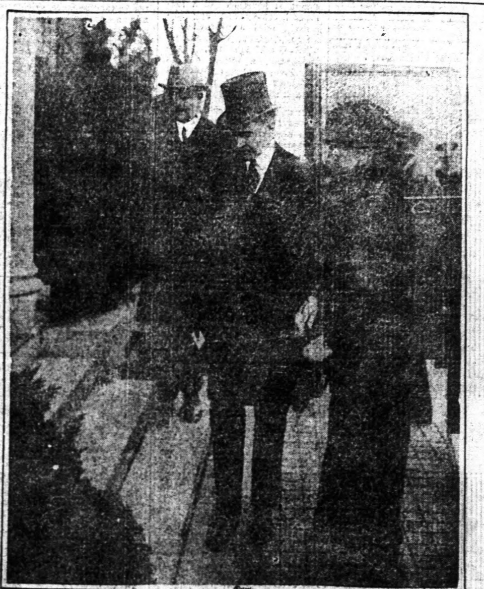
Coolidge elnök és felesége megérkeznek az elhunyt Wilson ex-elnök 8 streeti lakása elé.