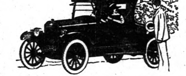
Chevrolet Motor Co., Detroit, Michigan Division of General Motors Corporation

VERÉS NEM GYÓGYITJA KI A GYEREKET AZ AGYBA-VIZELÉSŐL. Hason használja az Insurit, az a világ-híró készítmény, melyet szerez és szerez használnak annak az egészséges székletnek megállítására. Insuritből készült készítmény 5 dollárba jön, 7 dollár 50 cent a teljes készlet felállításához. Birtoklás a csomagban 10 cent. Portmóniában küldjük a pénz átvételére. *Laxol Laxol Co., Detroit, Mich., U. S. A. Box 983, 132 Laxol Bldg., Pittsburgh, Pa.