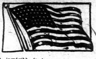
A legrégibb és legnagyobb magyar lap Amerikában.