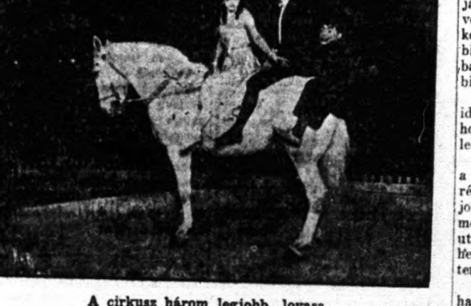
A cirkusz három legjobb lovasa.

Az egész hetes cirkusz-előadást Woodland avenue sarkán levő központi irodába, ahol kap fáradsága jutalmául egy ingyen beléptijegyet. Ne elégedjünk meg tíz jegy eladásával, keressünk újabb tíz jegyet az irodában s adjuk el azt is, akik ugyanis legtöbb jegyet adnak el, azok közt tíz értékes ajándékot oszt ki a cirkusz-bizottság. Megnyerhetik a legtöbb előadók majd az estéknek kiválasztott díjakat, vagy az utolsó este kisorsolódó nagy Chevrolet autómobilét.