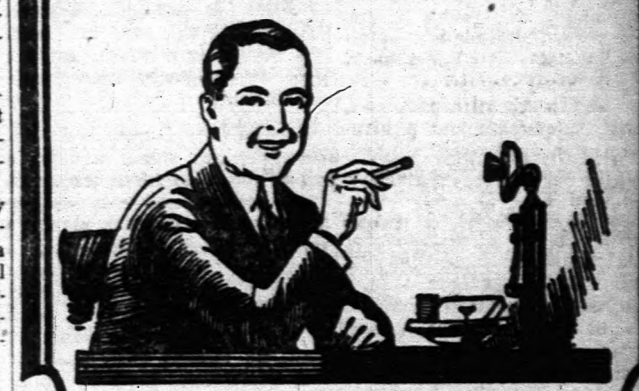
A legjobb minőségű Török és Egyiptomi cigaretták gyártói a világban.

A HELMART cigaretták karton dobozokba vannak csomagolva, hogy össze ne törjenek.