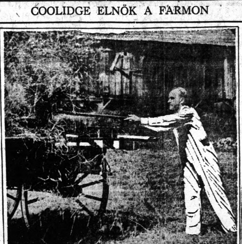
Coolidge elnök tudvalegleg ádes apja Plymouth-farmján nyaral. Az elnök egybekötötti a kollektív munkásokkal versenyzve derekasan dolgozik.

ROYAL MFG. CO. Duguesne, Pa. Chicago, Ill. Chicago, Ill.