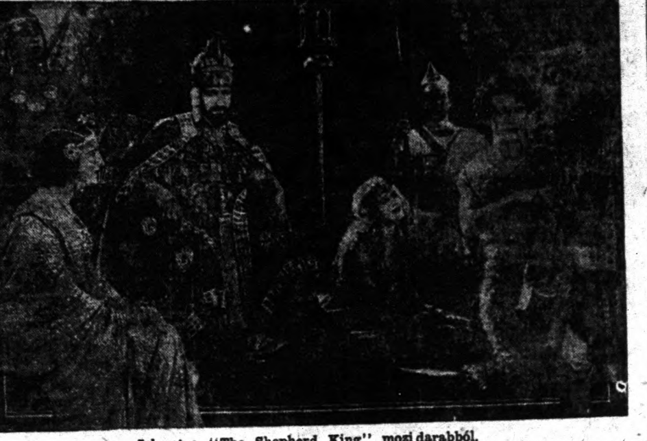
Jelenet a "The Shepherd King" mozi darabából.